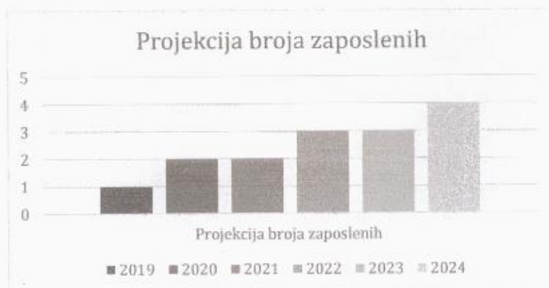
Grafički prikaz: Plan kretanja broja zaposlenih po godinama

Planirano kretanje broja zaposlenih prikazano je grafičkim prikazom u nastavku, a odnosi se na period od 2019. g. – 2024. g. Grafički prikaz prikazuje broj zaposlenih, u odnosu na prethodne godine (prosječan broj zaposlenih) što je rezultat restrukturiranja tvrtke, do kojeg je došlo kroz projekciju budućeg poslovanja tvrtke.